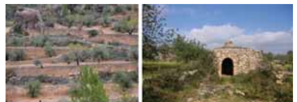
Exemples de murs i cabana de pedra seca

S'hi inclouen també paisatges amb una gran càrrega simbòlica i identitària per la població (el santuari de Sant Magí de la Brufaganya, el cingle Major de Montsant o el bosc de Poblet) i d'altres amb valors religiosos, com els territoris dels monestirs de Santa Maria de Poblet i Santes Creus.