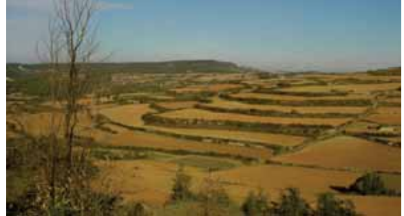
Conreus esglaonats, un valor identitari de la Baix Segarra

concret, identifica, cartogràficament, per a les diferents zones o elements del territori, quina mena d'objectius o d'estratègies serien les preferents