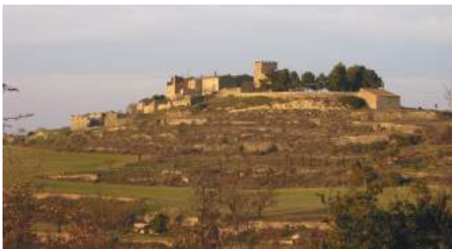
La Pobla de Ferran

Podria començar la crònica dels fets explicant o recordant què passava l'any 1928. Fer allò que a