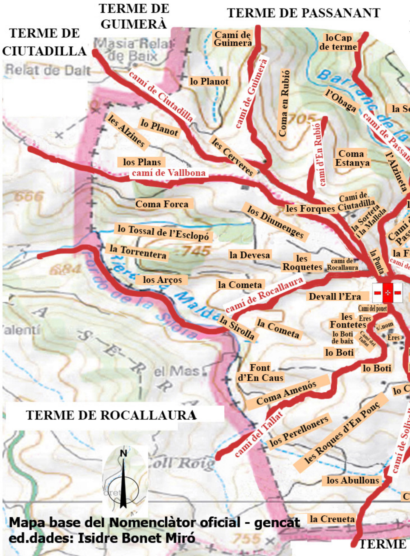
Mapa base del Nomenclàtor oficial - gencat ed.dades: Isidre Bonet Miró